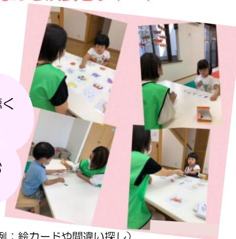
(活動一例：絵カードや間違い探し)